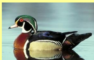
Canard branchu Kanitshipaushtikueshit