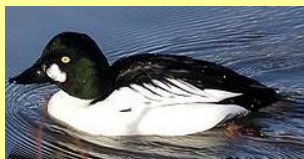
Garrot à œil d'or Mishekush