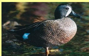
Sarcelle à ailes bleues Ilineshik u