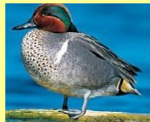
Sarcelle d'hiver Ilineshik u