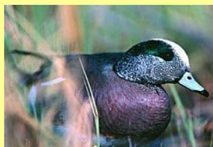
Canard d'Amérique Mishekush