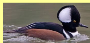
Harle couronné Mishekush