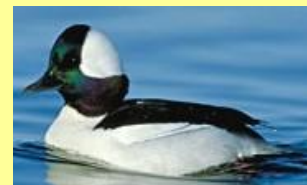
Petit garrot Mishekush