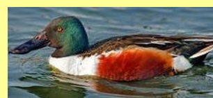
Canard souchet Ilineshik u