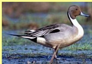
Canard Pilet Ilineshik u