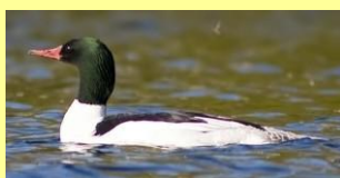
Grand harle Napeshik u