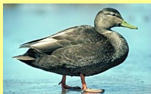
Canard noir Ilineshik u