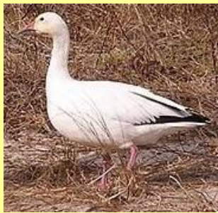
Oie des neiges Uapishk