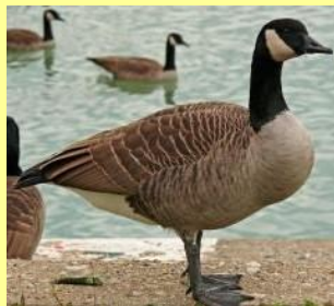
Bernache du Canada Nishk