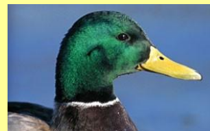
Canard Colvert Mishekush